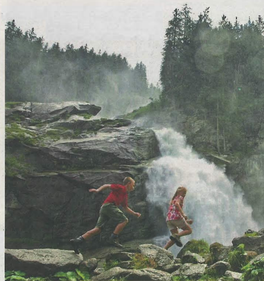
Die asthmakranken Kinder des „Splash Camps“ können in Krimml Kraft tanken und nach Herzenslust spielen.

Bei einem Besuch überreichte der Vorstand des Rotary Clubs Salzburg Paracelsus 10.000 Euro an die PMU und die Organisatoren des „Splash Camp“, um die Forschungen voranzutreiben und den Aufenthalt mehrerer asthmakrankender Kinder zu unterstützen.