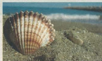
Muschel am Strand, von Eva.