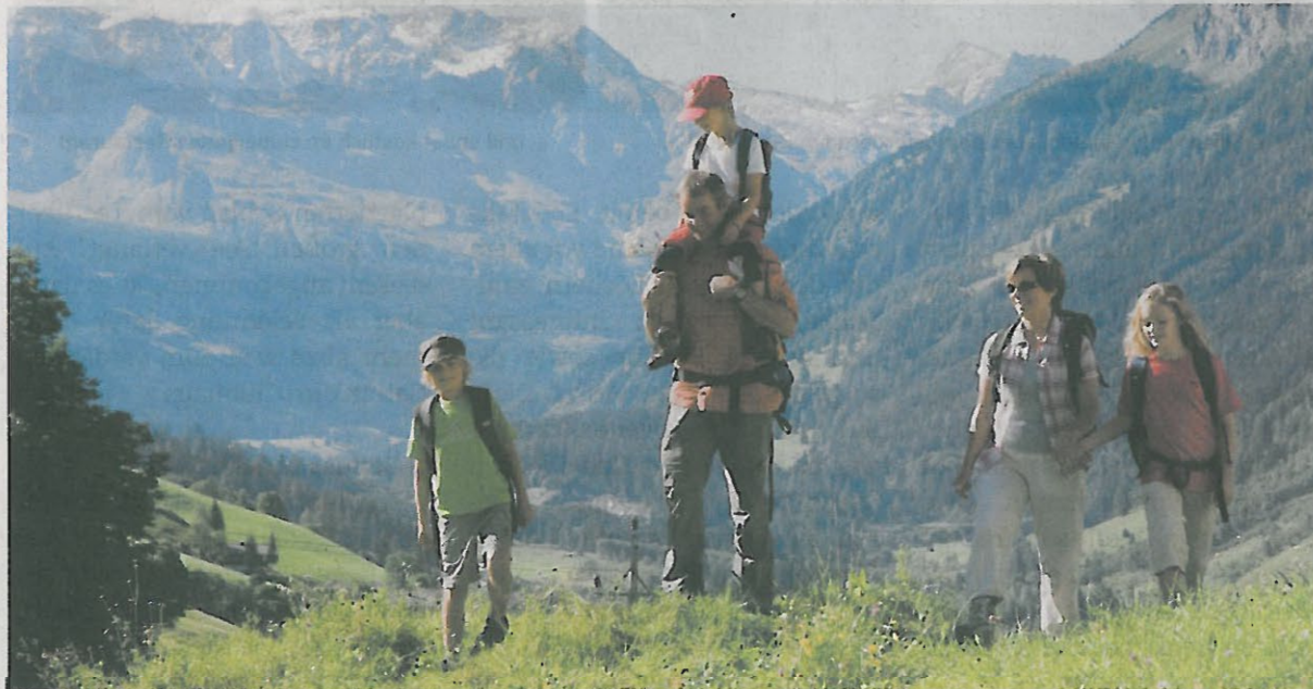
Ein Gesundheits- und Erlebnisurlaub, der der ganzen Familie Freude bereitet.

möchten, ist mindestens zwei Wochen im Nationalpark Hohe Tauern zu verbringen und zwar in einem unserer „Hohe Tauern Health“-zertifizierten allergikerfreundlichen Hotels, kombiniert mit einem täglichen Aufatmen an den Krimmler Wasserfällen. In unseren „Hohe Tauern Health Gesundheitshotels“ finden Sie dazu die richtige, universitär zertifizierte und allergikerfreundliche Atmosphäre, um im Urlaub gut und reizfrei durchzuschlafen zu können.